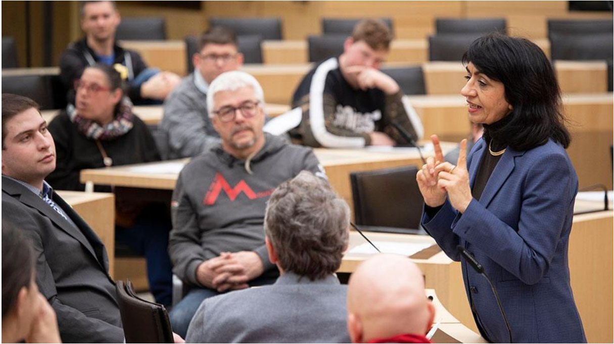
Homepage des Landtags; heruntergeladen am 15.02.2024